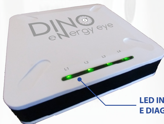
LED INDICATORI ENERGIA E DIAGNOSTICA (L1,L2,L3,L4)