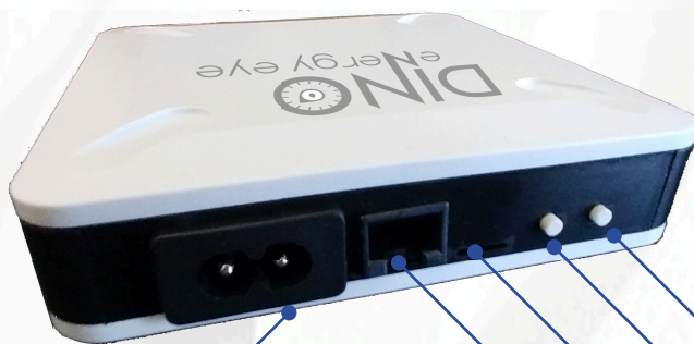
ALIMENTAZIONE (utilizzare l'apposito cavo C8 di alimentazione in dotazione)